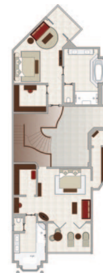
Suite Royale (à l'étage)