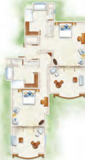
Suite Famille Tropicale