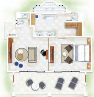
Suites Océan Front de Mer