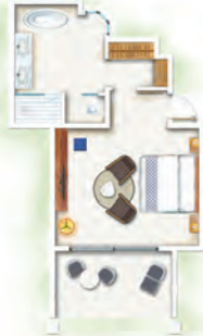
Chambres Océan Front de Mer