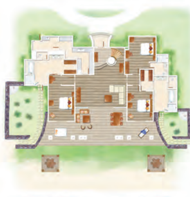
Villa Présidentielle (rez-de-chaussée)