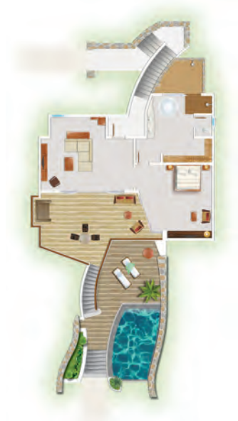
Suite Senior Front de mer avec piscine