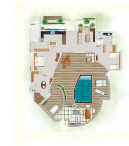
Villa de 2 chambres