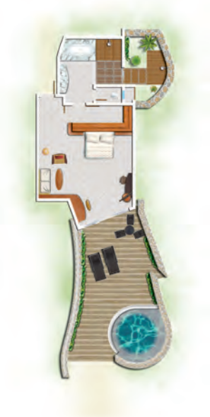
Suite Front de mer avec piscine