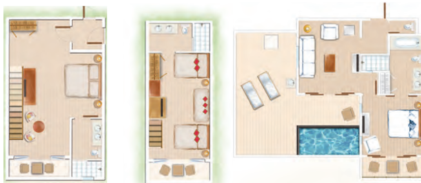
Loft Chambre principale