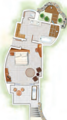
Suite Junior Tropicale