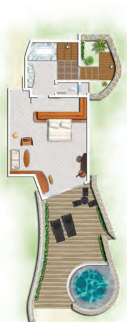
Suite Front de mer avec piscine