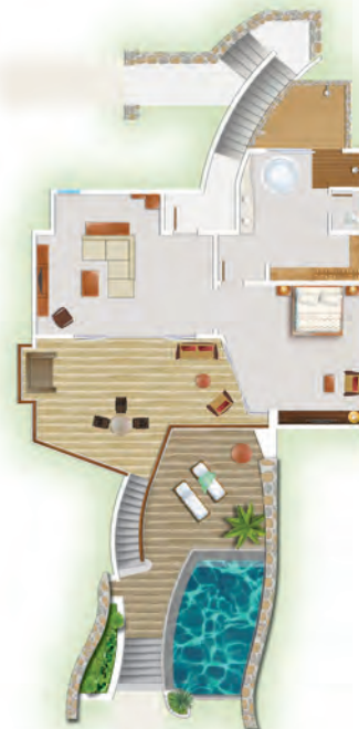
Suites Senior Front de mer avec piscine