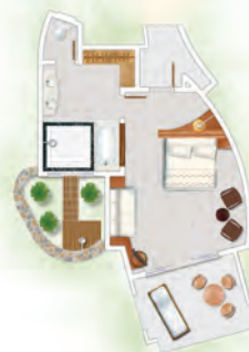
Suite Junior Tropicale +